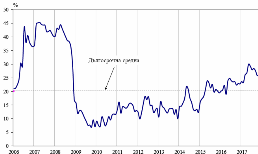
Фиг. 1. Бизнес климат - общо

По данни на Националния статистически институт през декември 2017 г. общият показател на бизнес климата се понижава с 1.6 пункта спрямо ноември 2017 г. По-неблагоприятен бизнес климат е регистриран в промишлеността, строителството и сектора на услугите, докато в търговията на дребно запазва приблизително равнището си от предходния месец.