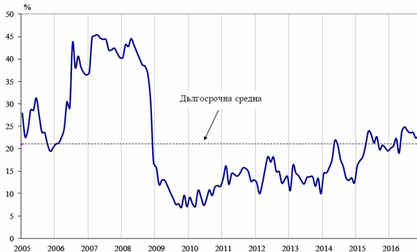
Фиг. 1. Бизнес климат - общо

Съставният показател „бизнес климат в промишлеността“ нараства с 2.3 пункта в сравнение с ноември, което се дължи на подобрените оценки и очаквания на промишлените предприемачи за бизнес състоянието на предприятията. Същевременно обаче осигуреността на производството с поръчки се оценява като леко намалена, което е съпроводено и с понижени очаквания за производствената активност през следващите три месеца.